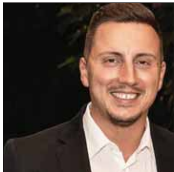
di Piergiuseppe Iorillo

Verso l'estate: dieci bandiere blu nel Lazio, Latina ha problemi a reperire bagnini e Ardea vuole aprire uno sportello turistico. Al porto di Anzio si lavora per portare vi ala sabbia in eccesso