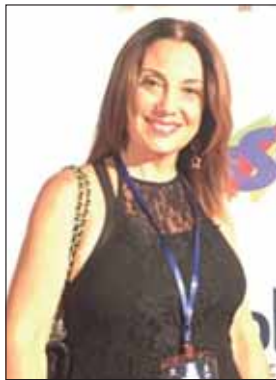
di Patrizia Rocchi Furlan

L'8 aprile 2023 è ricorso il cinquantesimo anniversario della morte dell'artista spagnolo Pablo Picasso, per l'occasione è stato ed è tuttora commemorato con quaranta mostre retrospettive in otto paesi, co-organizzate dai governi di Francia e Spagna, per celebrare la sua vita, le sue opere e la sua eredità artistica.