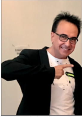
a cura di Angelo Martini Conduttore - Musicista Giornalista Televisivo e Musicale

Angelo Martini si racconta nel programma "Pamela viaggia in latin", intervistato da Pamela D'Amico, su Rai Isoradio ricorda l'incontro e la sua intervista indimenticabile al King mondiale del Reggaeton, Daddy Yankee, nel lontano 2013. Il format ideato dalla brava cantautrice dedicato al mondo latino-americano condotto egregiamente con grande competenza, diventato un cult del panorama radiofonico ita-