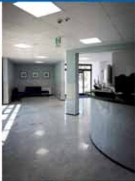
Centro di Fisioterapia e Riabilitazione