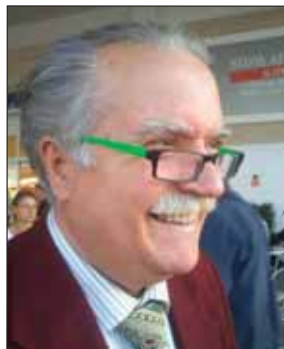
di Salvatore Lonoce

Cari lettori, i tuberi sono tutti uguali. Ma alcuni sono più uguali degli altri. Oggi, come non mai, si vola alto nel dibattito politico locale. Il saper fare nella nostra città che è sempre stato un modello e un'eccellenza non è facile. La terra di Aprilia, è capace di grandi imprese, nel senso di aziende grandi, e di una forte e radicata capacità di lavoro e di impresa, che viene da una cultura cattolica. Cari amici questa è la nostra città che, troppo spesso, chi non la conosce si presenta come gretta, tesa solo al guadagno, ai soldi per i soldi. Aprilia invece custodisce valori forti di solidarietà, che si ispirano alla dottrina sociale della Chiesa che in questa città ha avuto esponenti di primo piano. In questo quadro, la politica è sempre stata un aspetto centrale, un meccanismo attraverso il