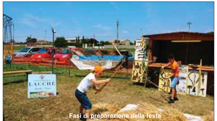
Fasi di preparazione della festa