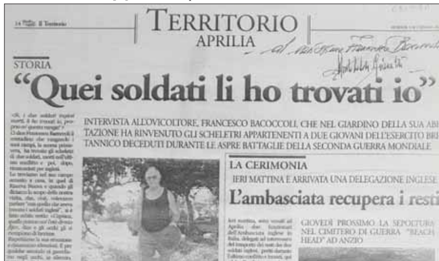
Il Territorio 3.9.2014