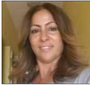
a cura di Sihem Zrelli

“Dietro ogni impresa di successo c’è qualcuno che ha preso una decisione coraggiosa.”