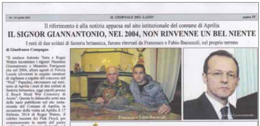
Il Giornale del Lazio 10.4.2014

colo, per quanto aspro, non appaiono diretto a colpire la sfera morale o il valore umano di singoli soggetti, ma a censurare l'uso del sito istituzionale da parte dell'Amministrazione Comunale. Essi sono, dunque funzionali ad esprimere un personale giudizio negativo su tale Amministrazione, senza trasmettere in gratuiti attacchi alle persone e a loro patrimonio morale, privi di collegamento funzionale con il giudizio negativo che si intendeva esprimere. Per tale ragione sono scriminati dal diritto di critica. Nell'articolo, peraltro, si indicano con nome e cognome, le fonti da cui il giornalista avrebbe appreso che la notizia pubblicata sul sito del