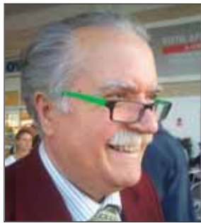
di Salvatore Lonoce

Cari amici, si dice sempre che il maltempo è il grande accusato per le buche di Aprilia: le piogge delle ultime settimane vengono additate come il principale responsabile di questo grave deterioro cittadino.