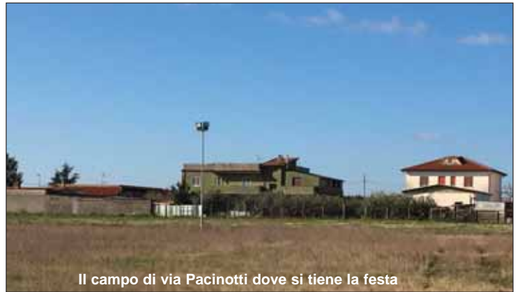
Il campo di via Pacinotti dove si tiene la festa

I piedi di queste persone sono ben piantate sul terreno che calpestano e vi risiedono nel sentimento di appartenenza al gioco civico con gli altri quartieri e con le città limitrofe: "Qualche tempo fa abbiamo partecipato ad alcuni incontri con gli altri comitati di quartiere per coordinare il calendario delle rispettive feste e non sovrapporle. Alla fine hanno aderito a questa iniziativa solo otto dei ventisette comitati esistenti. Noi ci siamo ricostituiti in comitato dopo molti anni di assenza. Dopo quella del 1982, abbiamo realizzato di nuovo la nostra festa nel 2013. Comunque ci siamo resi subito conto