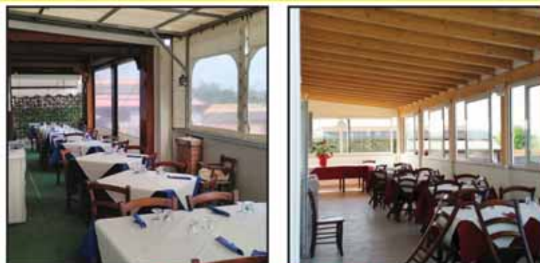
ANTE E POST OPERA